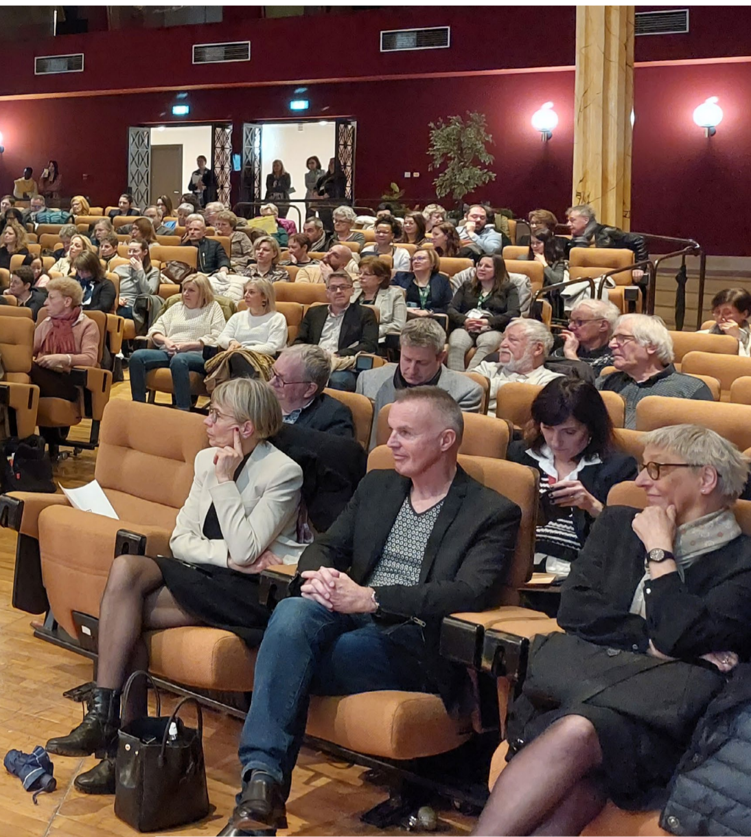
Le 13 mars dernier, 250 personnes ont assisté à la restitution des travaux du Schéma de l'Autonomie 2023/2027