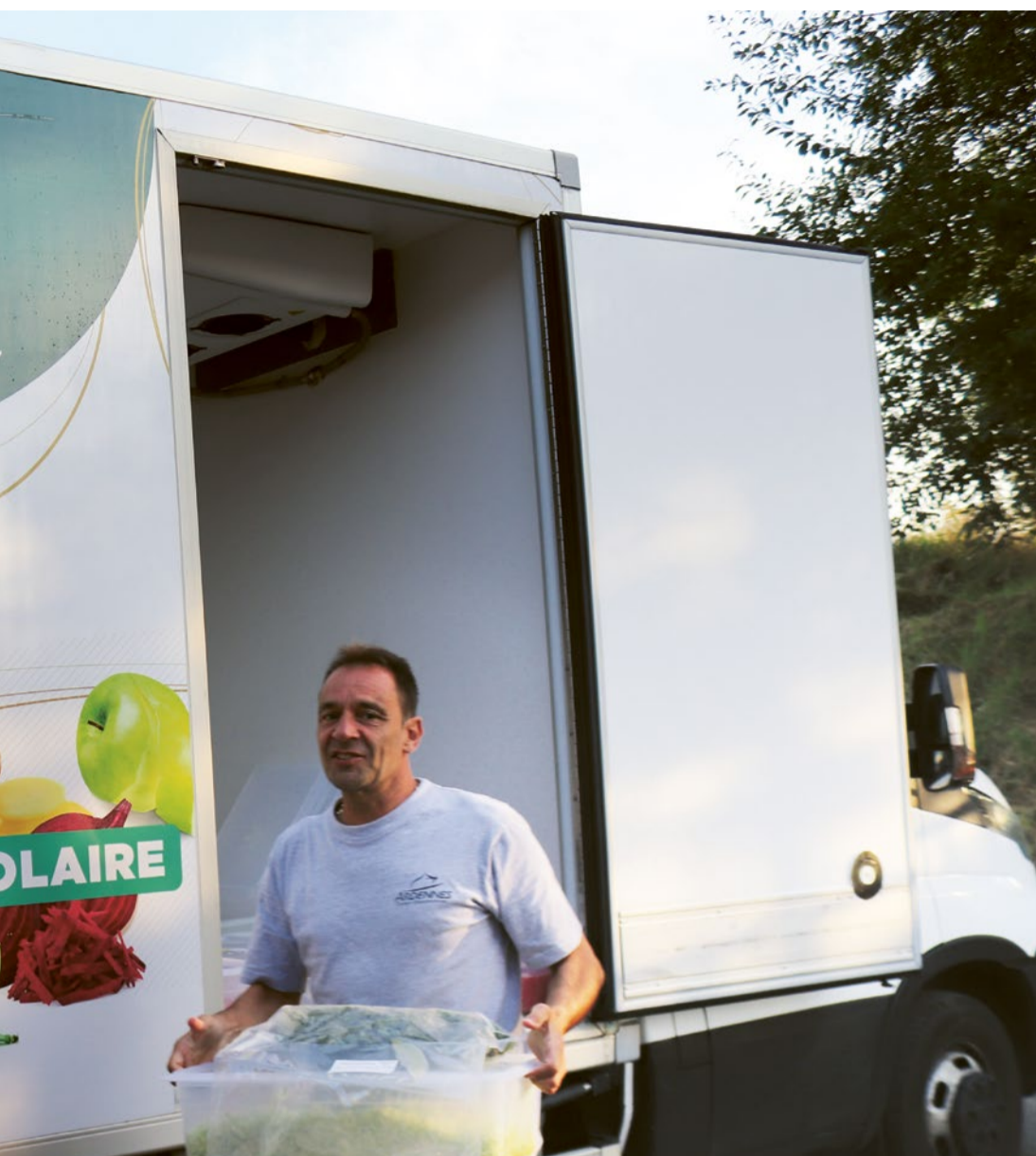
La Légumerie départementale alimente 11 collèges en fruits et légumes préparés selon les besoins des cuisiniers.