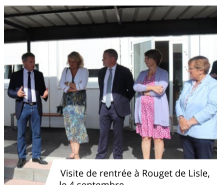
Visite de rentrée à Rouget de Lisle, le 4 septembre.

Outre Rouget de Lisle, le CD08 a investi dans plusieurs collèges du territoire ardennais pour près de 200 000 €. Équipements de cuisine, toitures, menuiseries ou encore éclairages, près d'une quinzaine d'établissements ont ainsi bénéficié de chantiers estivaux.