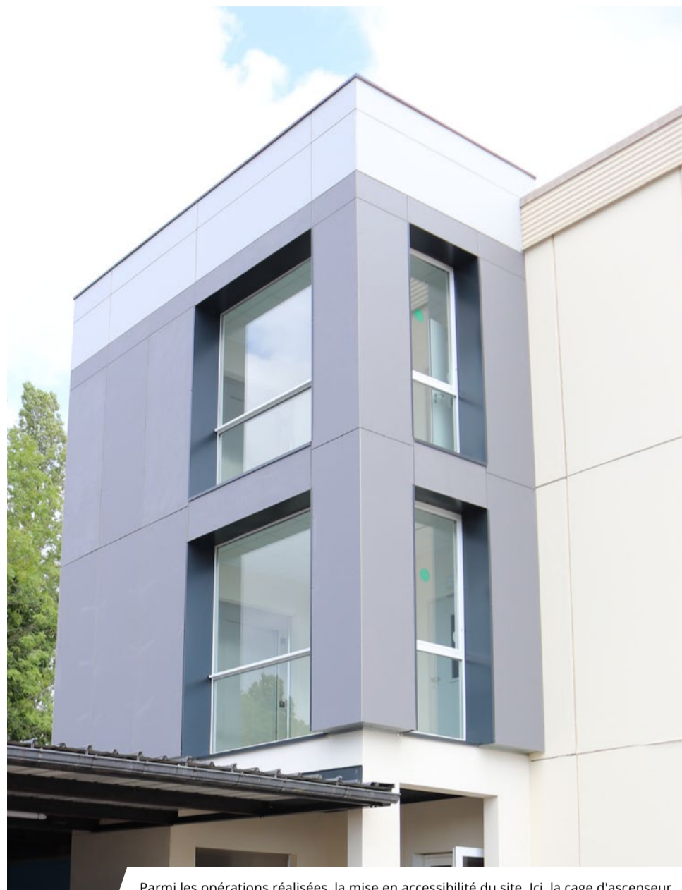
Parmi les opérations réalisées, la mise en accessibilité du site. Ici, la cage d'ascenseur.