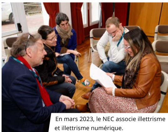
En mars 2023, le NEC associe illettrisme et illettrisme numérique.

On est le premier NEC à s'être mobilisé sur la double problématique inclusion numérique/illettrisme. Si l'on parle d'inclusion numérique, il faut qu'on parle d'illettrisme ; cette double réflexion est née du Collectif.