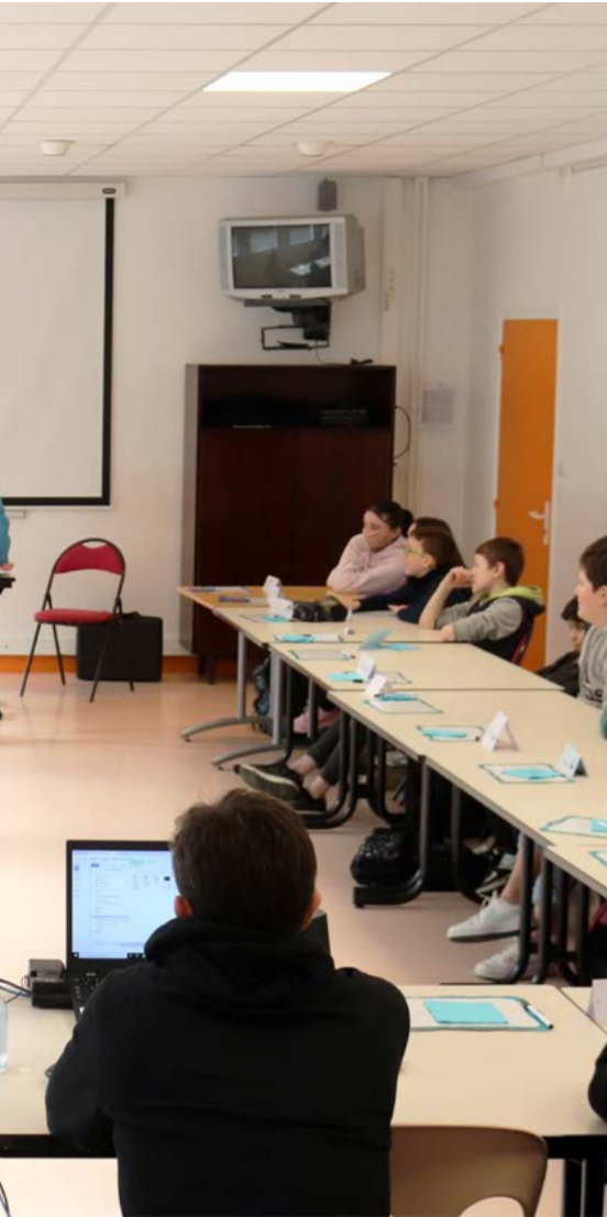
Le théâtre permet aux collégiens de comprendre les émotions.