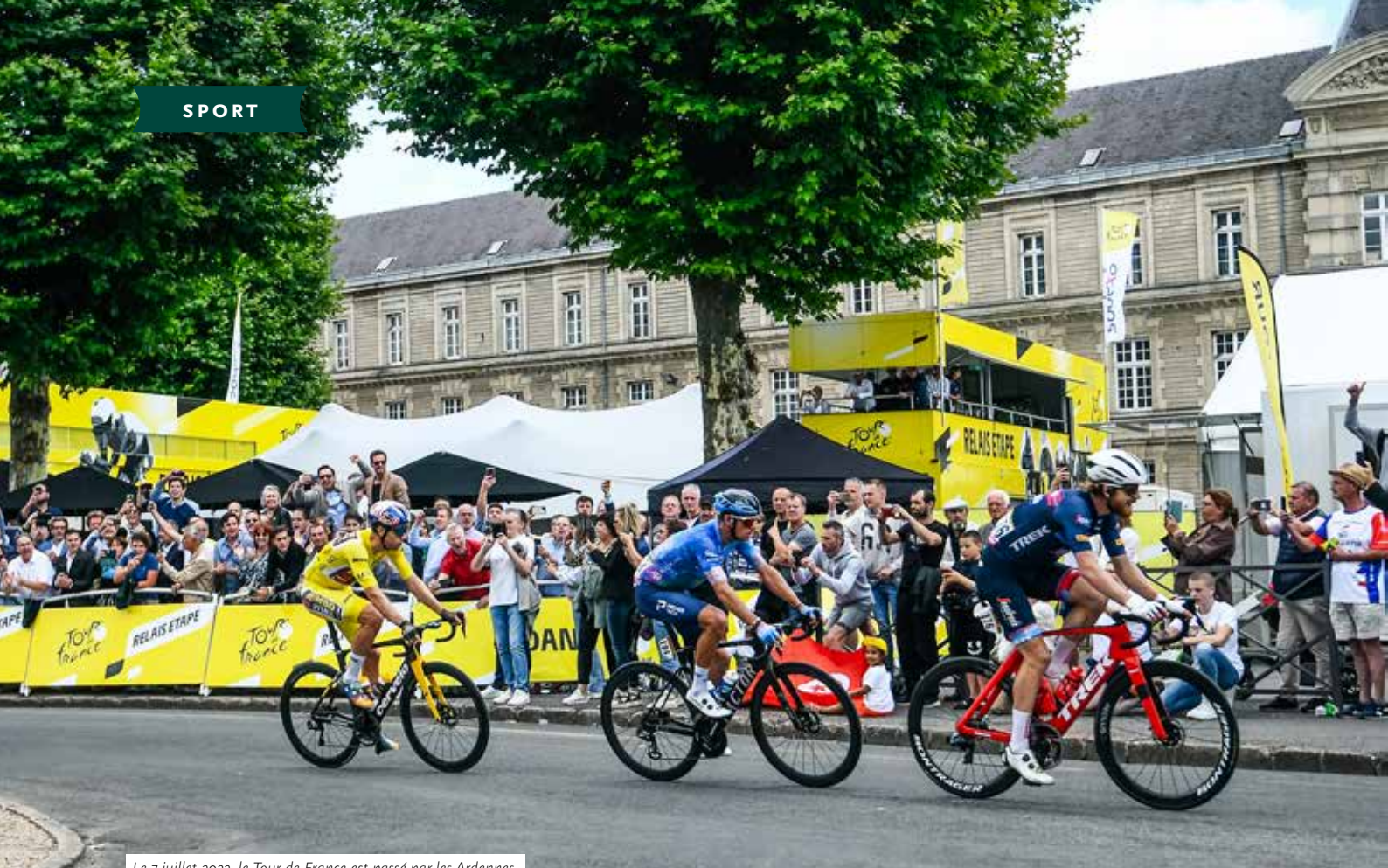
Le 7 juillet 2022, le Tour de France est passé par les Ardennes.