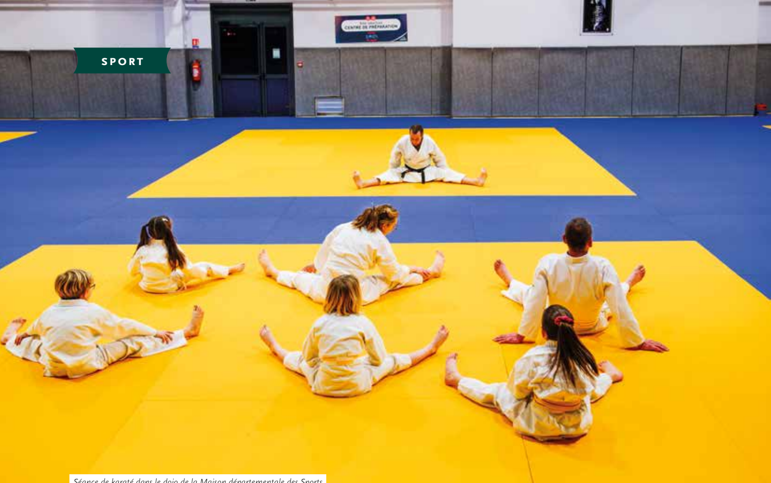
Séance de karaté dans le dojo de la Maison départementale des Sports