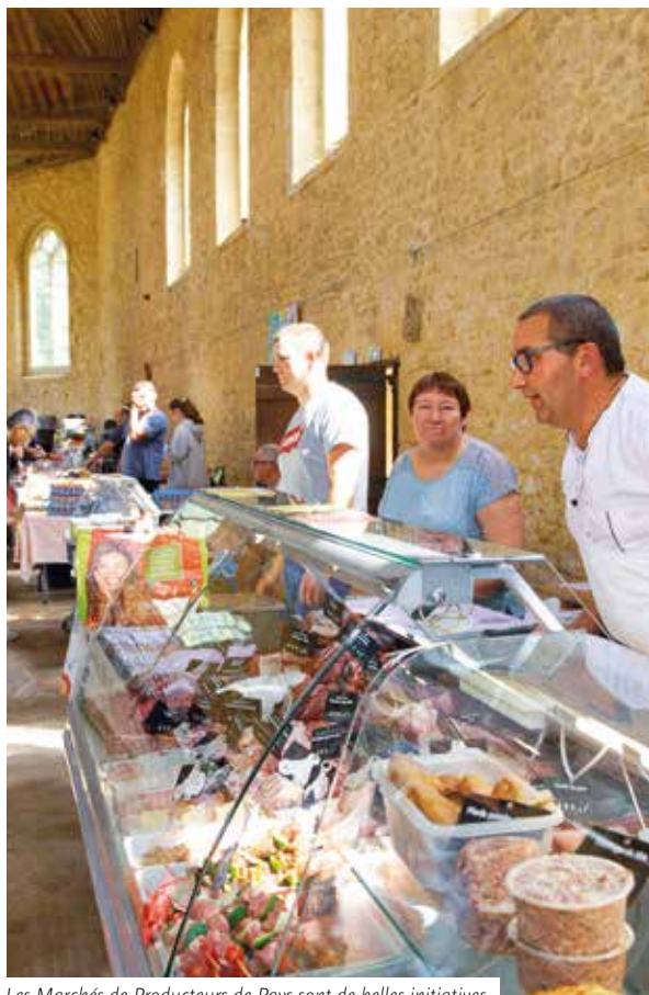
Les Marchés de Producteurs de Pays sont de belles initiatives.

CA : On doit oser encore plus ! Nos plats typiques devraient être mis en valeur autrement, en revisitant et en adaptant les recettes. À mon goût, il y a un vrai potentiel qui reste à exploiter comme les poissons de rivière, les champignons ou le gibier. Et puis, on assiste au retour des plats faits maison, avec une attention particulière apportée au circuit-court et à la saisonnalité des produits. C'est une vraie chance pour les Ardennes ! Preuve en est : les estaminets dans le Nord ou les winstubs en Alsace sont toujours remplis de monde.