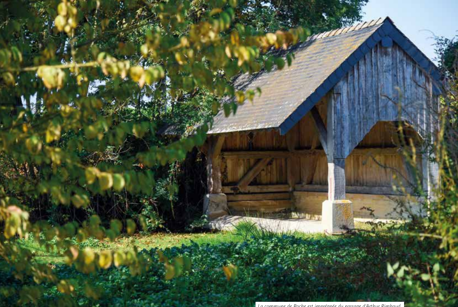
La commune de Roche est imprégnée du passage d'Arthur Rimbaud.