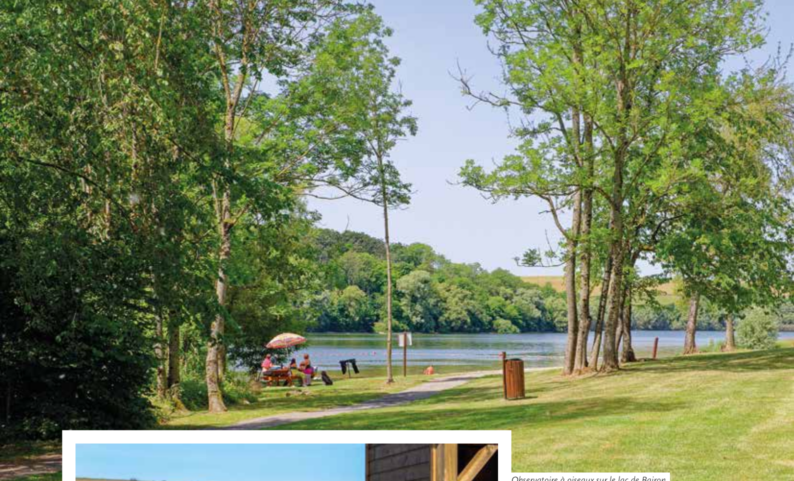
Observatoire à oiseaux sur le lac de Bairon